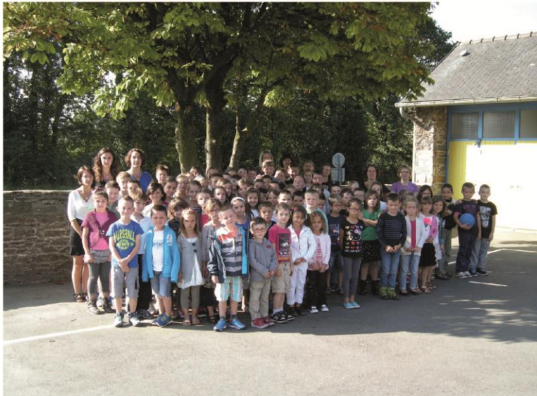
Photo de rentrée des classes 2014- 2015