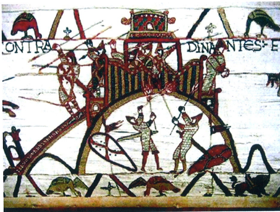
La motte de Dinan qui figure sur la Tapisserie de Bayeux

Le site de Kerlavarec est considéré comme étant en bon état de conservation. Pourtant, les petites enceintes médiévales sont très exposées à la destruction, et de cette fragilité constante émane la nécessité de les préserver. En effet, les chercheurs en castellologie signalent qu'une grande partie des sites répertoriés au XIXème siècle ont disparu. Ce site archéologique étant inscrit, il est donc soumis à l'application de la législation en vigueur sur les Monuments Historiques et sur l'archéologie.