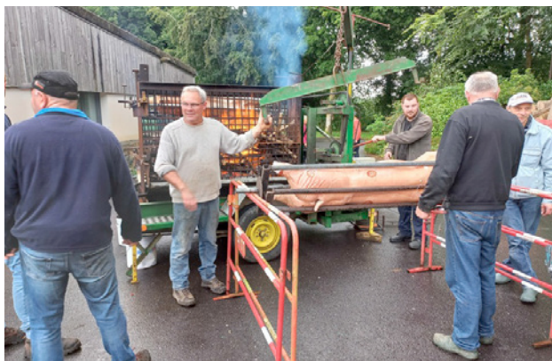
Les cochons sont embrochés et mis à cuire

Les membres du Plateau en Folie, les agriculteurs du plateau et les joueurs de foot de la SPPLM ont investi le parking situé devant le SIPP.