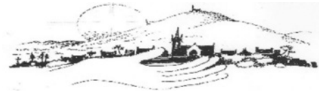
Ploudiry - La Martyre - Loc-Eguiner - Le Tréhou - Tréflévénéz