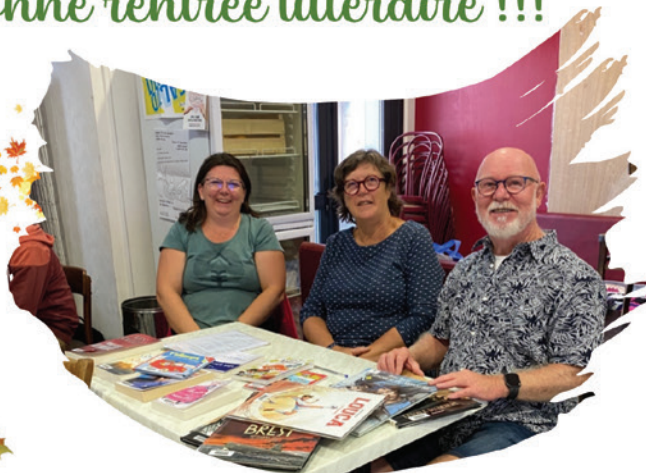
On y était ... Forum des associations - Le Tréhou, 03/09