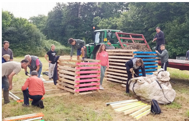
Les bénévoles en pleine action pour la préparation du feu

Je ne vais pas mettre des photos de tous les bénévoles. Mais certains ont pleuré en épluchant et coupant les oignons, d'autres étaient sous l'averse en montant les barnums et/ou en installant les tables et chaises, d'autres étaient au lavage des pommes de terre et encore d'autres à la plonge de la vaisselle. Bref les bénévoles étaient nombreux et très occupés.