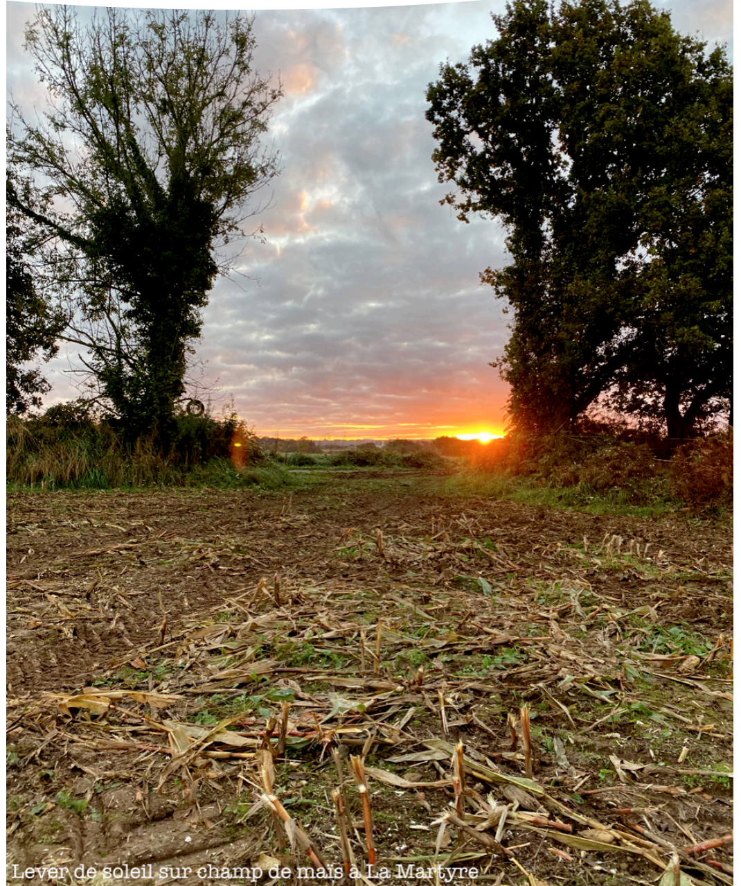
Lever de soleil sur champ de maïs à La Martyre