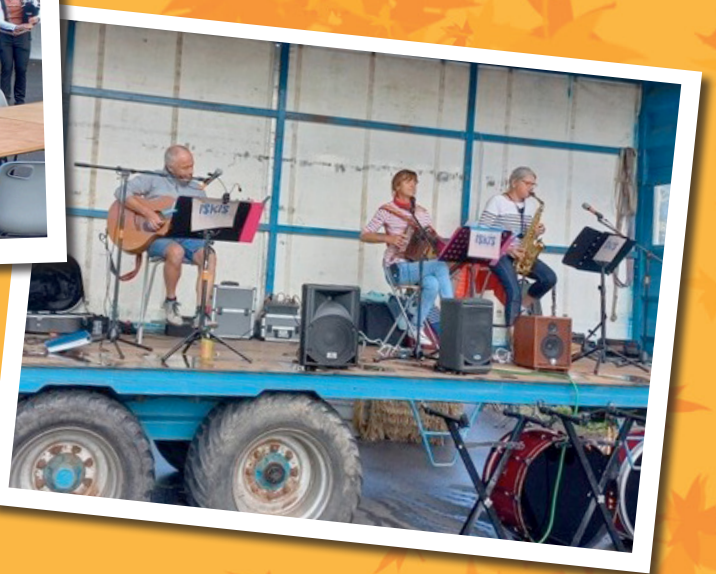
« Atout traits » le 16 juillet