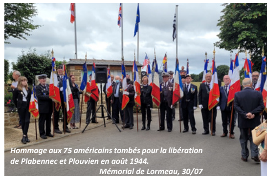
Hommage aux 75 américains tombés pour la libération de Plabennec et Plouvien en août 1944. Mémorial de Lormeau, 30/07