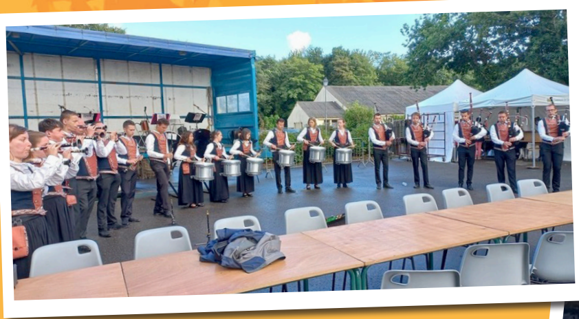
Les « Régalades » édition juin 2022