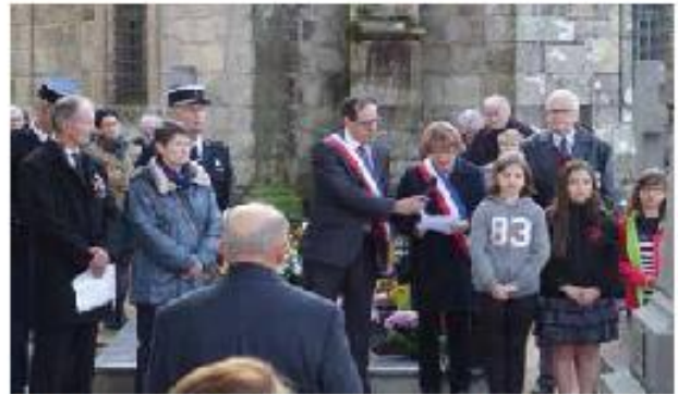
La cérémonie de commémoration du 11 Novembre se tenait à La Martyre celle année