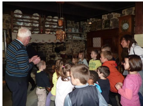
La maison d'autrefois

Journée intéressante qui pourra être renouvelée, même si c'est déjà la deuxième, (après la journée calèche à Landunvez...).