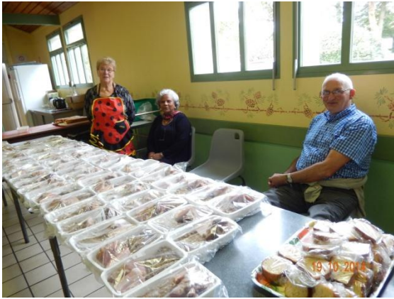
En attente pour les parts à emporter

Le kig ha farz traditionnel du dimanche 19 octobre, a permis de distribuer quelque 180 parts à consommer sur place ou à emporter.