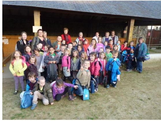
Le groupe des enfants de l'ALSH devant le préau