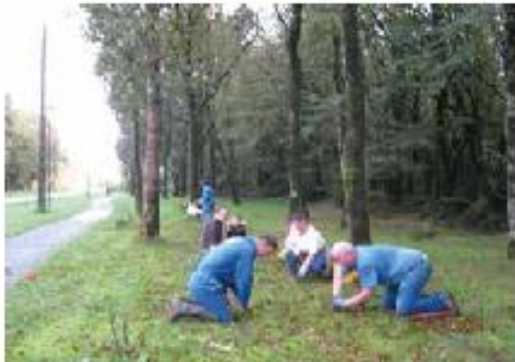
Le conseil municipal en plein travail : surprises à venir au printemps !