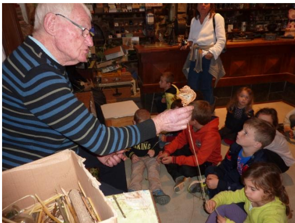
Démonstration d'un hochet en jonc

Les retraités qui animent ce musée s'étaient mis à la portée de chacun dans leurs démonstrations, que ce soit : dans la maison (fabrication du beurre, du pain, des crêpes, l'écrémeuse...) la fabrication des sabots, les jeux d'autrefois ( avec de la paille, du jonc,...)