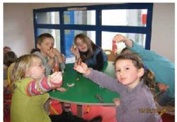
Distribution de pères Noël en chocolat à la cantine : On reconnaît les gourmands !