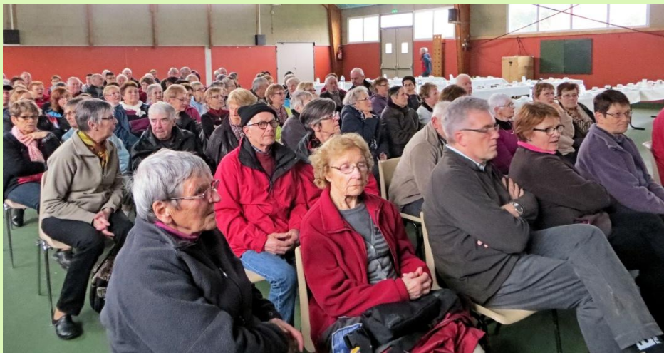
Plus d'une centaine d'adhérents participait à cette assemblée générale

Le conseil d'administration demeure inchangé, le tiers sortant se représentant.