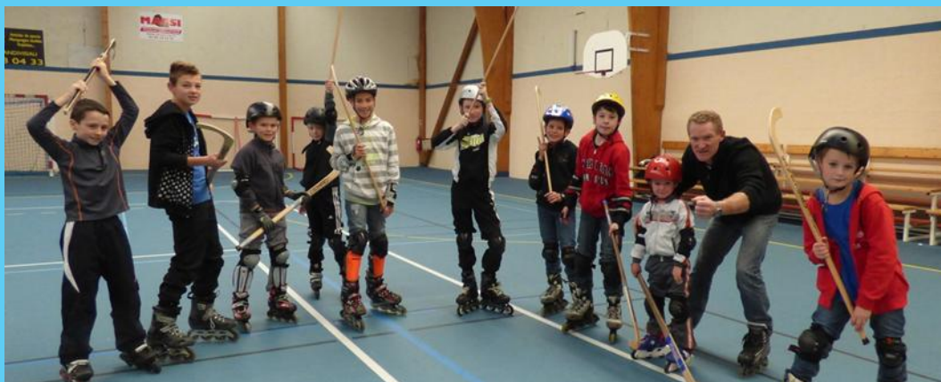
Le roller : une activité qui roule !!