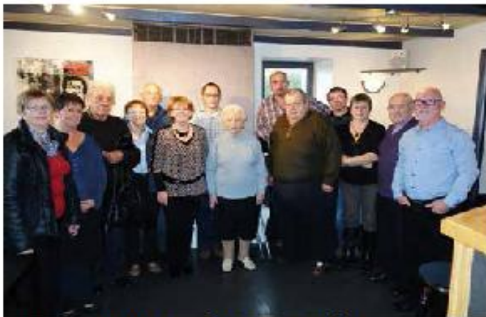
Repas du CCAS : les doyens et les nouveaux (avec les membres du CCAS et la municipalité)