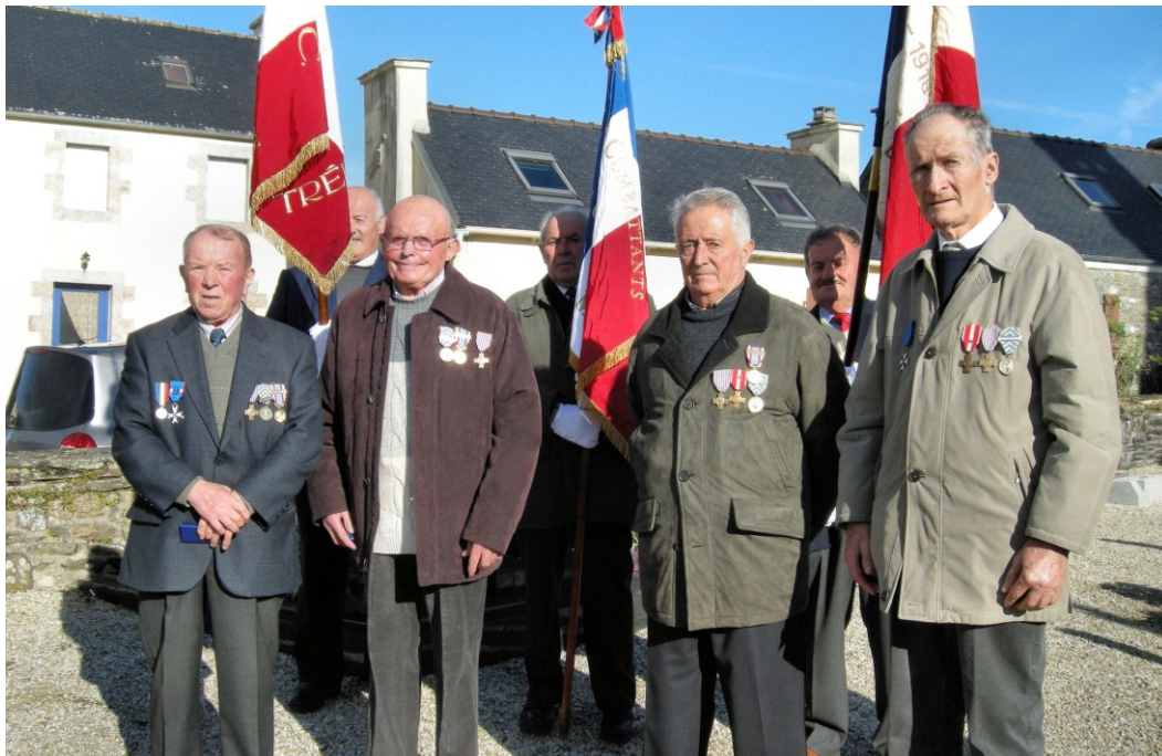
Les décorés, en présence du Président, du vice-Président et des porte-drapeaux

Un apéritif offert par la municipalité clôturait cette cérémonie. Les anciens combattants et leurs épouses se retrouvaient ensuite pour partager un repas en commun au restaurant du Queff dans une ambiance très conviviale.