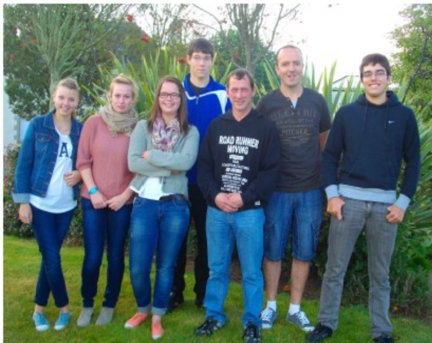
Les Jeunes arbitres et les arbitres du club

Concernant les manifestations, le Club a connu un grand succès avec le loto organisé le 28/10/2012. Prochainement, nous allons lancer notre traditionnelle vente de galettes des rois, qui sera ensuite suivie par une soirée crêpes à volonté qui est fixée au 2 Mars 2013 à la salle St Ildut à Sizun.