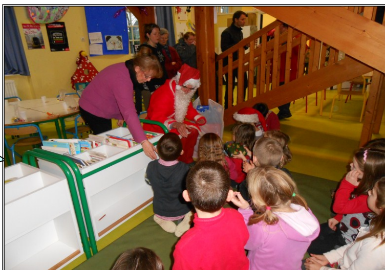
Merci Père Noël !!!!

Le père Noël nous a rendu visite Le lundi 17 décembre. Il nous a apporté des cadeaux pour La maison des enfants.