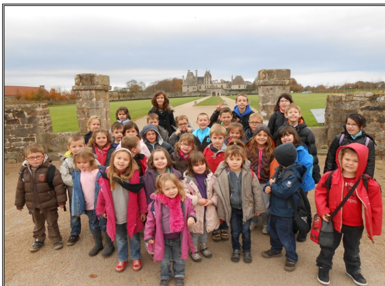
Les enfants devant le château de kerjean

Les enfants ont pu découvrir la vie de château au temps du Moyen Age lors de ces vacances. Au programme confection d'étendards et de petits châteaux forts... Troubadours, gueux et rois ont rythmés nos vacances. La sortie au château de Kerjean à St Vougay a rencontré un franc succès.