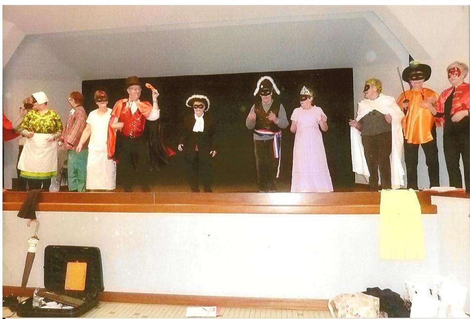
Le groupe en répétition générale du chant mimé le « bal masqué »

Au nombre de 25 bénévoles, avec des chansons, des chants mimés, des sketches,.... nous essayons d'apporter un peu de distraction aux résidents et nos prestations semblent être appréciées