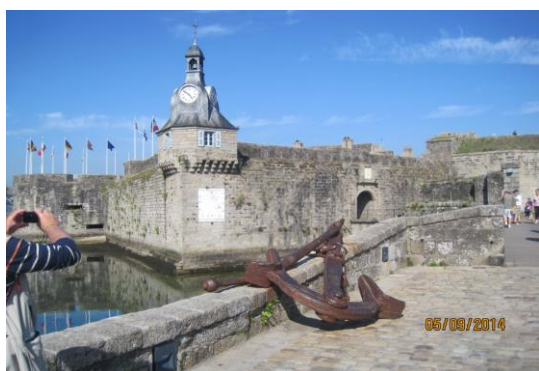
La porte d'entrée de la ville close

Passage par le port de pêche et le chantier naval et cap vers le large et les sables blancs puis retour par les anses du Cabellou et du Porzou. Merci à notre guide qui a su nous captiver.