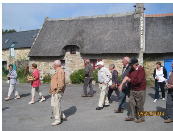
Toit d'ardoises et toit de chaume à Névez

A Concarneau visite de la Ville Close et embarquement sur le Popeye IV pour une heure de croisière.