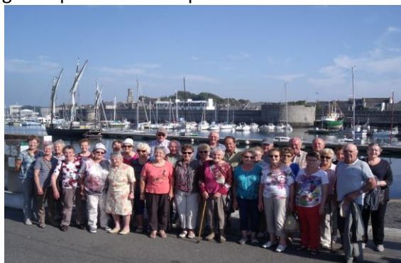
Le groupe devant le port de Concarneau

Prendre date : ➤ dimanche 19 octobre à midi, Kig Ha Farz du club à la Maison du Plateau ➤ jeudi 11 décembre, à 10h, Assemblée Générale du club à la Maison du plateau suivie du repas.