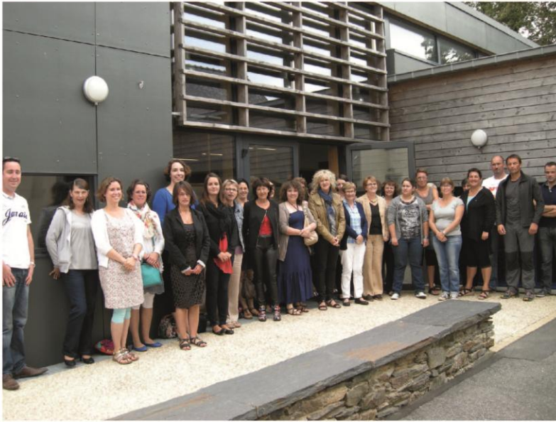
Pot de rentrée Personnel cantine, SIPP, enseignants, élus du Plateau