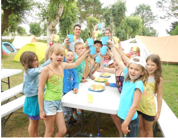
Camp 9-11 ans