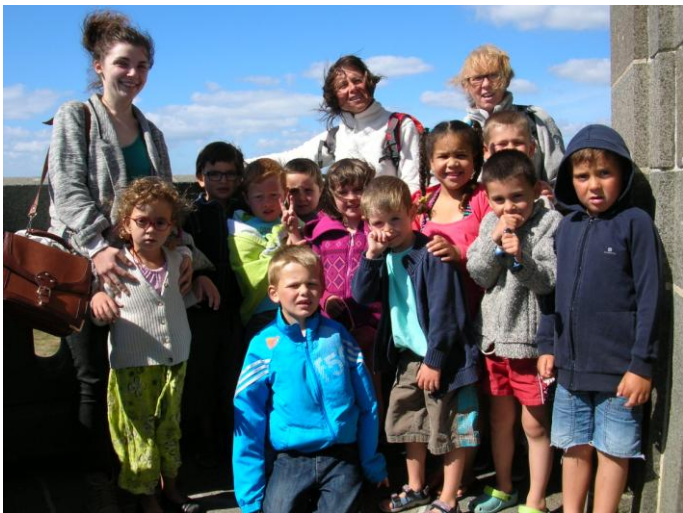
camp 5-6 ans