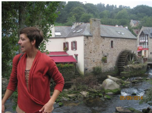
Notre guide devant un des 14 moulins

.Au bord de la mer, pays des chaumières et des pierres debout. Névez a conservé ce patrimoine culturel si pittoresque. Les maisons aux volets bleus, bordées d'hortensias, si typiques en Bretagne, représentant l'architecture traditionnelle d'autrefois.