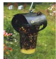
Un piège véto pharma