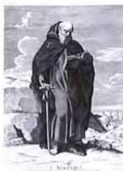
Estampe du XVIIe siècle représentant Saint-Antoine la cloche à la main droite. Recueil de C. Le Brun.

Saint Gildas, abbé renommé du monde celtique chrétien, fondateur de l'abbaye de Rhuy est aussi représenté avec une cloche. Réputé pour soigner la folie, il était fondeur de cloche.