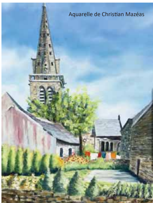
Aquarelle de Christian Mazéas

Vous y trouverez quelques indications qui vous aideront à trouver les contacts utiles pour une célébration