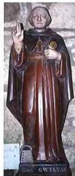
Statue de Saint Gildas dans l'église St-Gildas de Magoar (22). La cloche est à ses pieds.