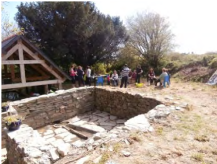
Le Lavoir à Ploudiry

Les deux juniors associations se sont retrouvées à Pleyben pour les rendez-vous de la Jeunesse, Le Kaléidoscope, où elles ont pu présenter leur projet et rencontrer d'autres jeunes.