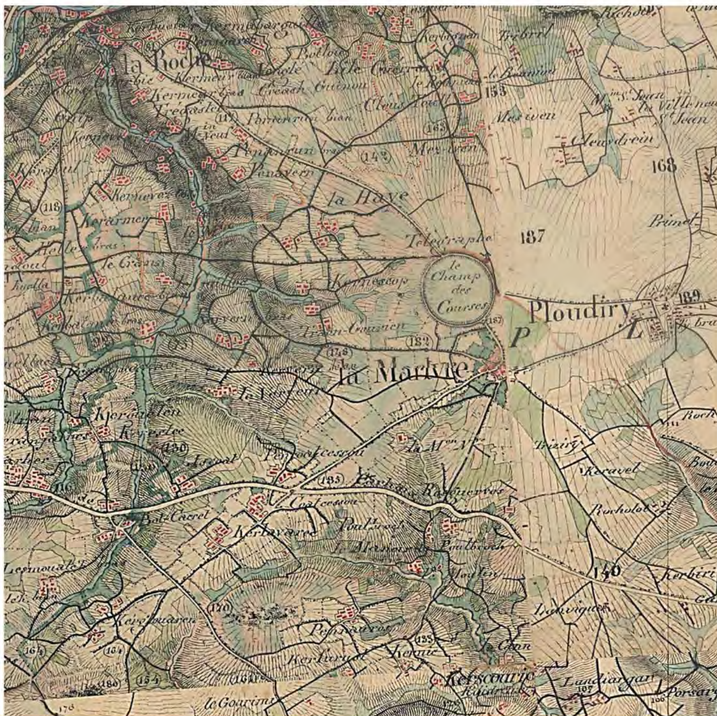
Carte de l'état major de 1820 à 1866 d'après « GEOPORTAIL ». www.geoportail.gouv.fr