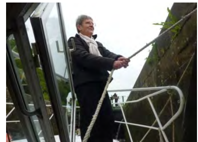
A l'écluse quand l'eau monte il faut stabiliser le bateau : ne larguez pas les amarres trop vite !