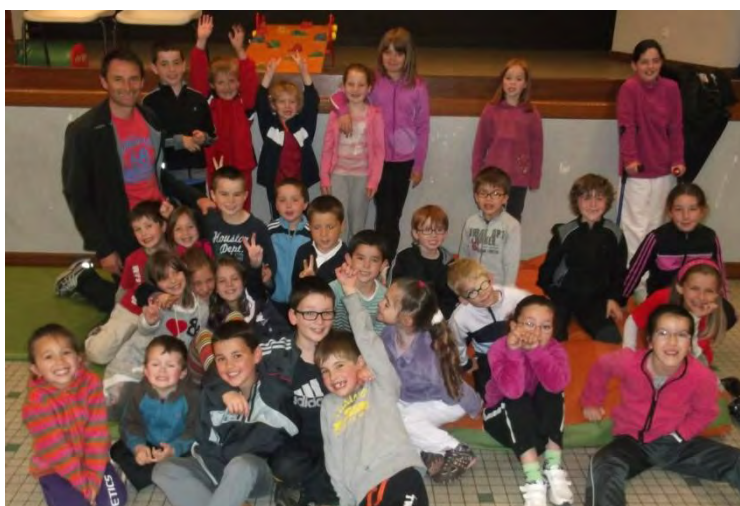
Les enfants lors de la dernière séance de la saison.

Nouveauté 2013, une séance de gym à Tréflévénéz le lundi soir !