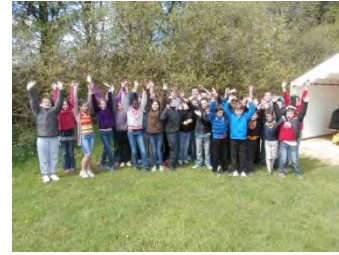
La Récré des 3 curés