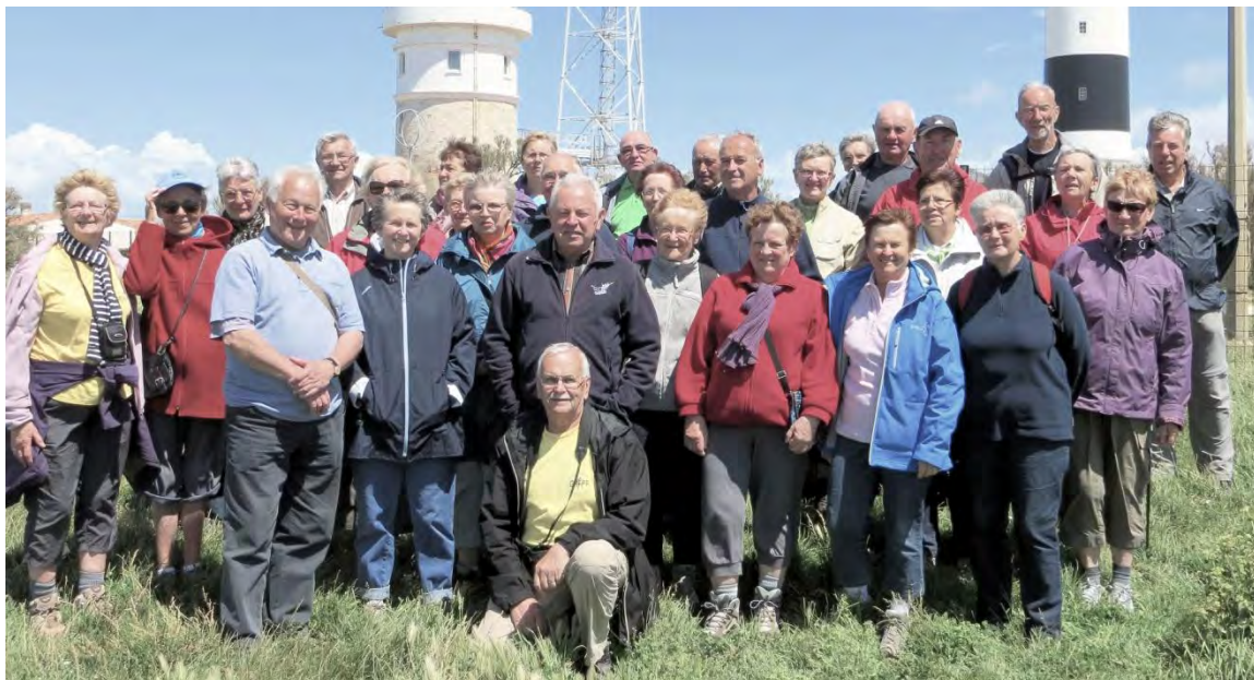
Le groupe des randonneurs devant le phare de Chassiron

C'est avec nostalgie et la tête pleine de merveilleux souvenirs que nous avons dû rejoindre le continent, en se promettant de revenir un jour dans cette île paradisiaque.