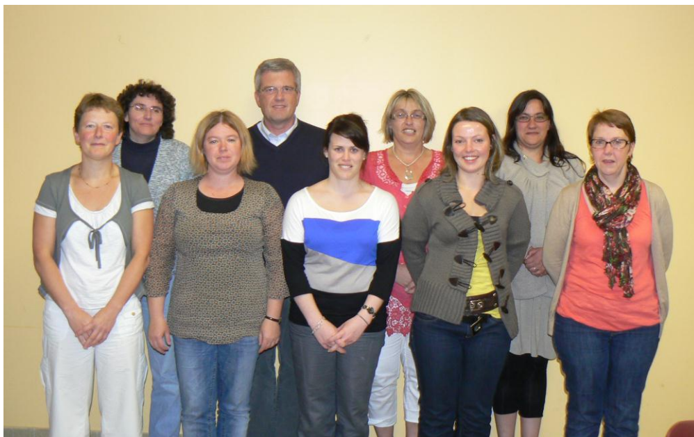
Le nouveau bureau