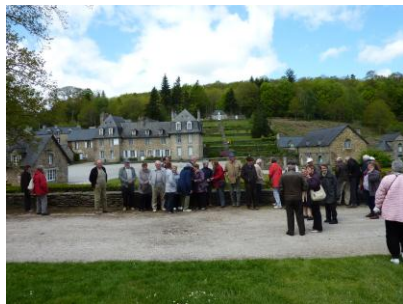
les Forges des Salles