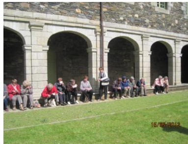
Cloître de l'Abbaye de Bon-Repos

C'est une ancienne abbaye cistercienne, fondée par Alain de Rohan. Après des années de crise et de renaissance auxquelles la révolution mit un point final, elle fut vendue comme bien national et tomba peu à peu en désuétude jusqu'à devenir carrière de pierres.