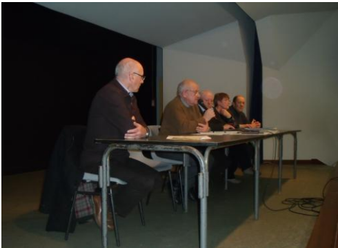
L'heure est au bilan

A l'issue de l'assemblée générale un goûter a rassemblé tous les participants qui ont aussi partagé la galette et tiré les rois.