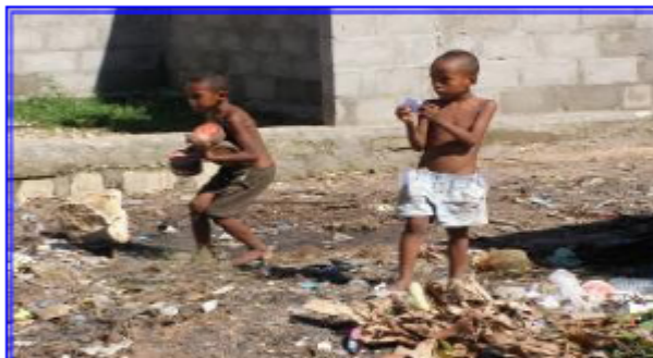
Enfants errant dans la rue à Majunga

Parrainez l'éducation d'enfants en grande difficulté à Madagascar