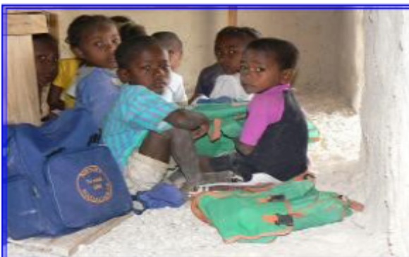
Ecole de brousse près de Majunga Il n'y a ni tables, ni chaises