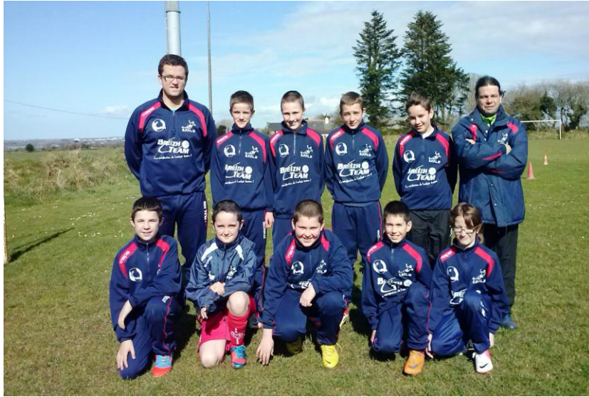
L'équipe U13 de la Saint Pierre Ploudiry La Martyre.