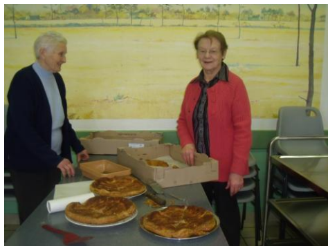
La galette paraît bien bonne