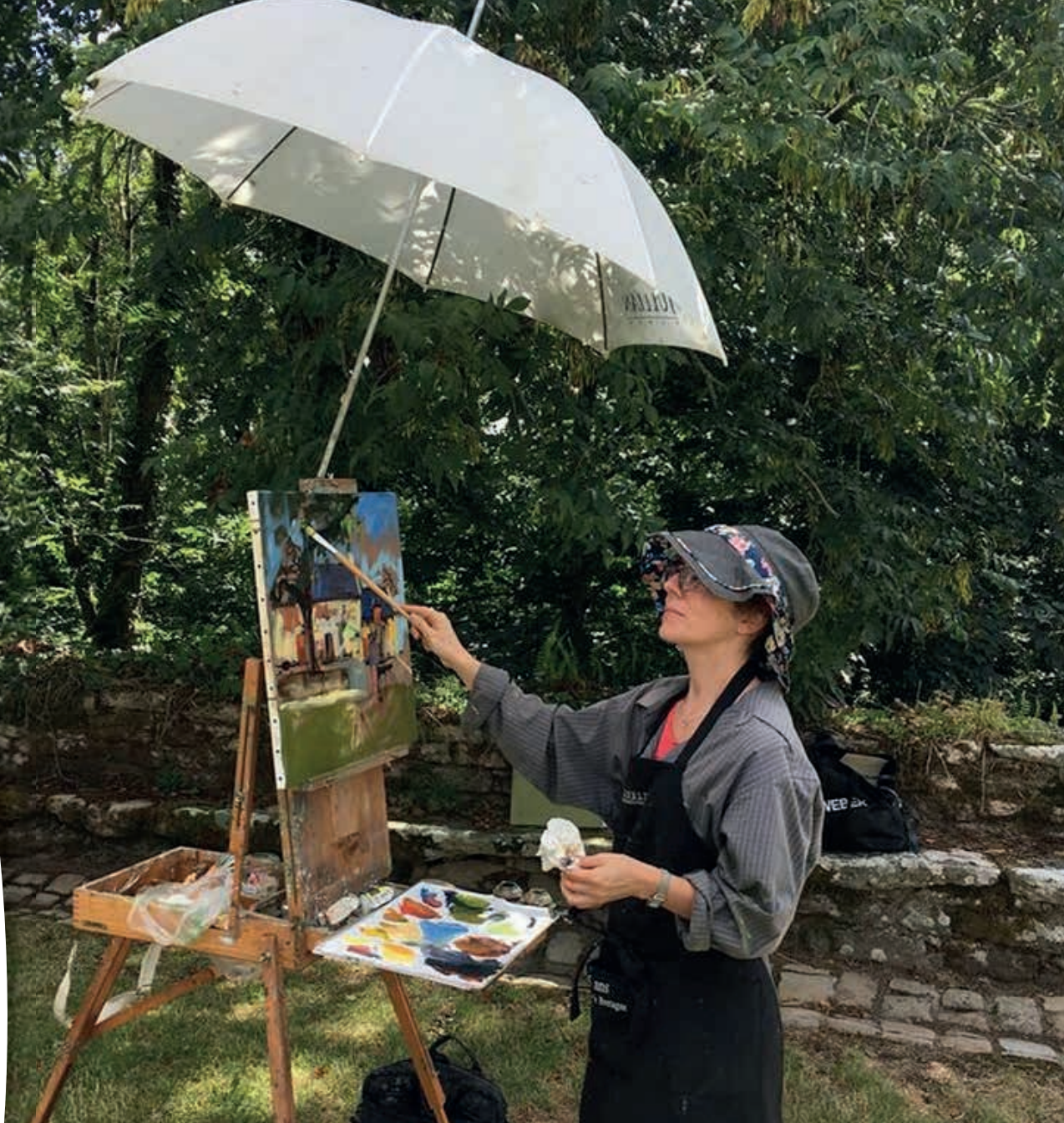
«Couleurs de Bretagne» à La Martyre - Samedi 13 juillet 2019