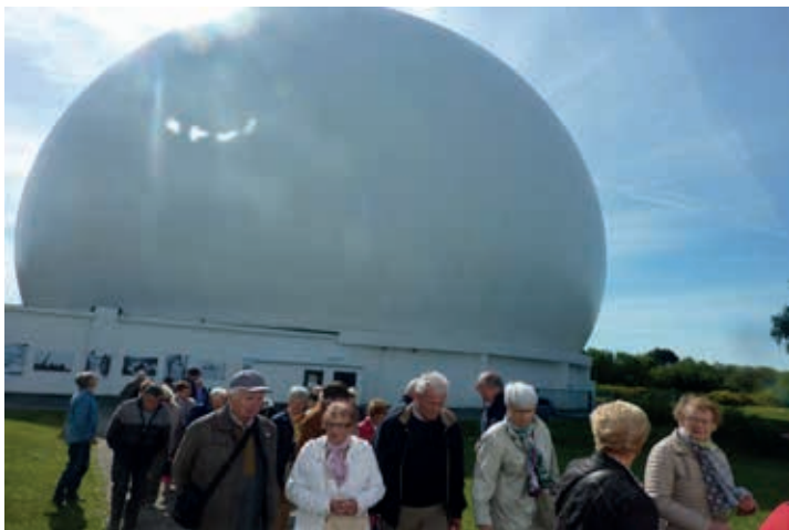
Le groupe devant le radome

Après un aperçu de la côte, le « Golf Saint Samson » nous attend pour le repas de midi, et la journée se poursuit par la côte de granit rose. Trébeurden, l'île grande, la pointe de Bihit, Trégastel –plage, le menhir de Saint Uzec, Ploumanach, Perros-Guirec et le sentier des douaniers : une journée ensoleillée, riche en paysages et en découvertes.