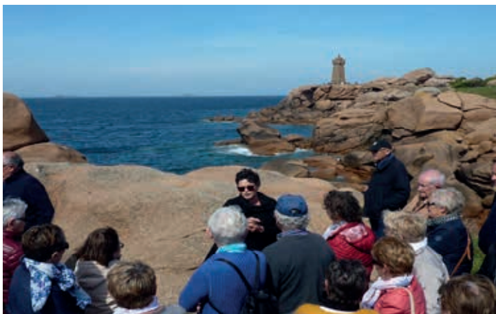
Avec la guide devant le phare de Méan Ruz